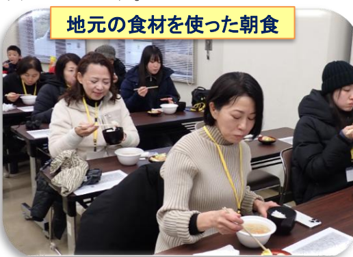
地元の食材を使った朝食