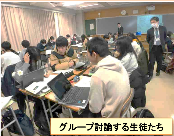
グループ討論する生徒たち