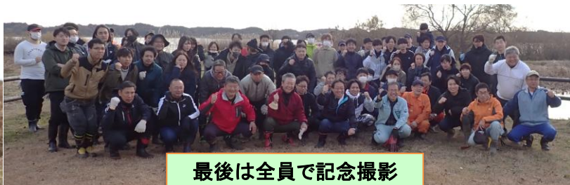
最後は全員で記念撮影

当日は天候にも恵まれ、作業は順調に進行しました。作業を行って頂いた皆様には、今後もカキツバタやヨシ原を見守って頂ければ幸いです。