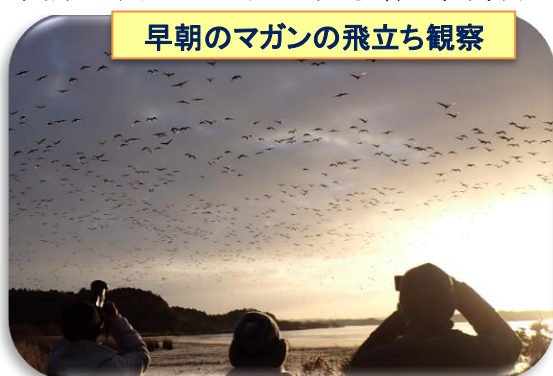
早朝のマガンの飛び立ち観察