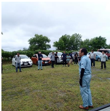
財団から実施内容を説明

今年は実施できたのは3回でしたが、延べ74名の方々に参加をいただきました。ありがとうございました。産卵床は合計5ヶ所確認され、バスの稚魚は確認されませんでした。