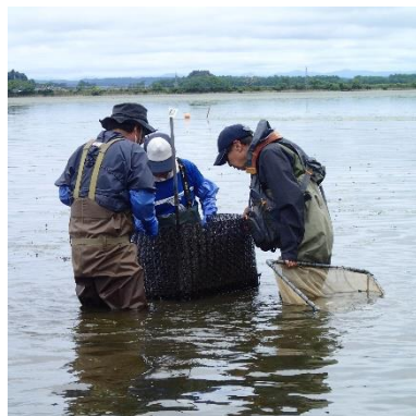
人工産卵床をチェック