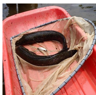
定置網で捕獲されたライギョ